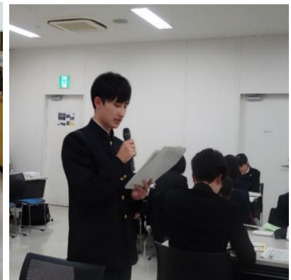
他校の文芸部員と交流し、作品についての感想や意見交換をしています