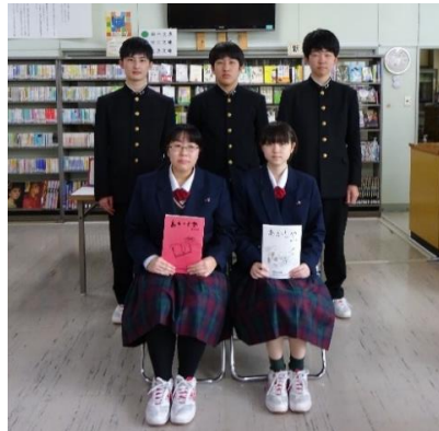
毎年、個性溢れる作品を創作し、部誌『あかしや』を発行しています