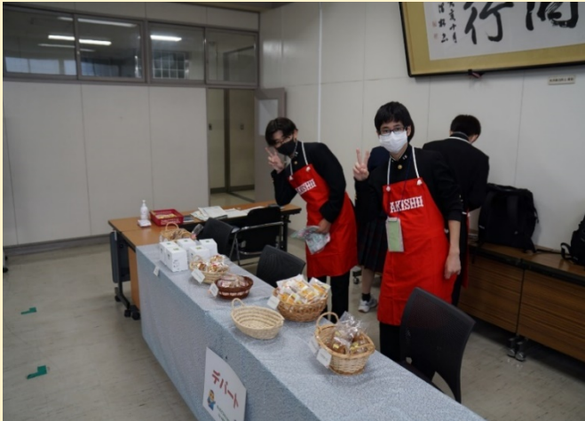
もう少しで商品完売です！