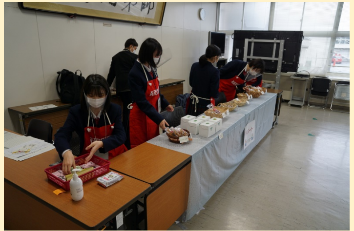
商品の在庫の確認をしています。