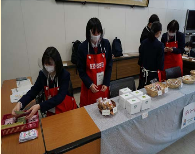
店員どうして打ち合わせをしています。