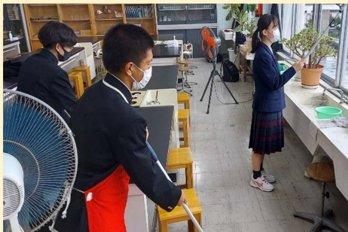
(実際に掃除をしている様子)