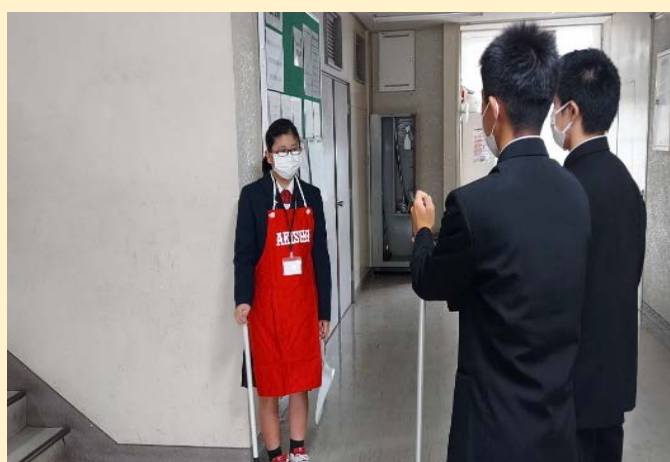
(掃除に関する説明中)