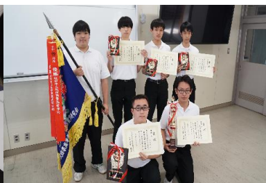
全国大会出場に向けて 日々、頑張っています。