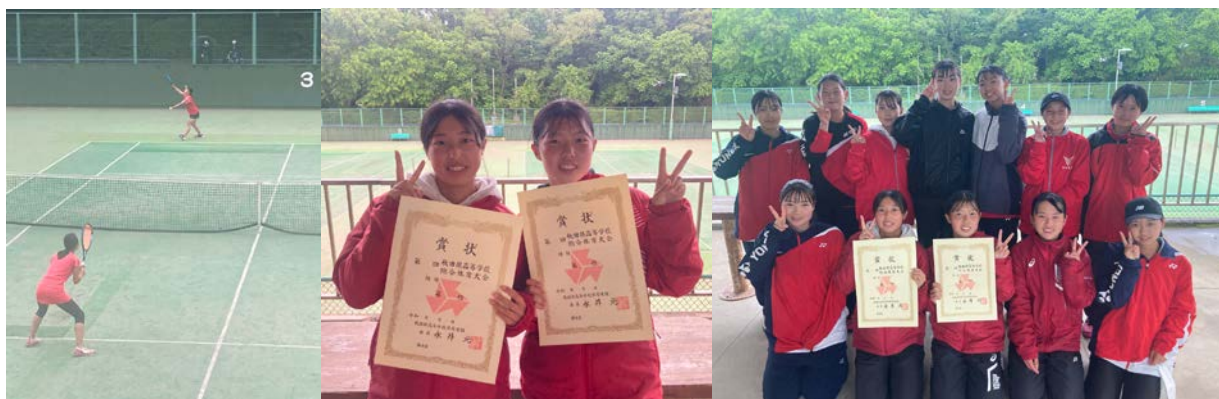
東北大会をかけて同校対決