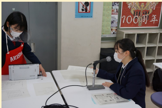
(収録している様子)